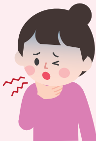
말하거나 숨쉬기 힘든 증상