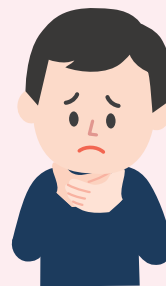
목을 움켜잡는 징후